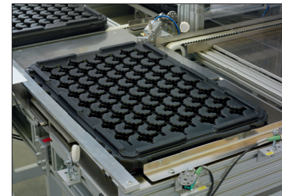
Befüllposition mit pneumatischer Zentrierung.