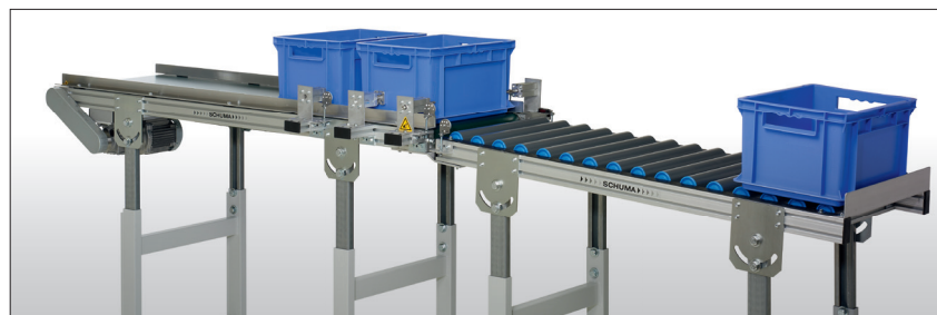
Stopposition und Zentrierung.