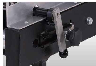
Einfache Verstellung des Separierspaltes.