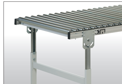
Rollenbahn mit Stahl- und Edelstahlrollenausführung.